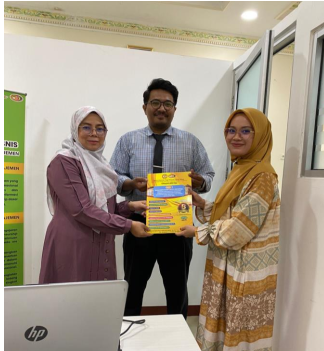
Gambar 1. Pelaksanaan Audit Mutu Program Studi Magister Manajemen